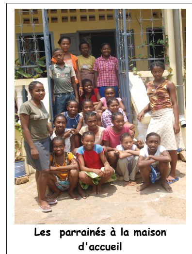
Les parrainés à la maison d'accueil

Nous avons rencontré les parents à plusieurs reprises. Ils se sont organisés en association, et semblent motivés pour suivre les études de leurs enfants.