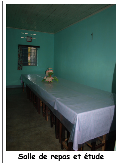
Salle de repas et étude