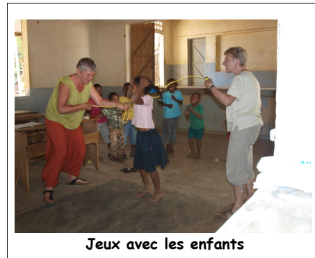
Jeux avec les enfants