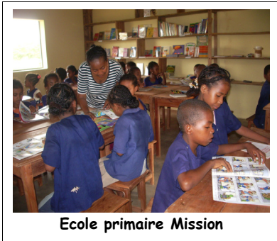
Ecole primaire Mission